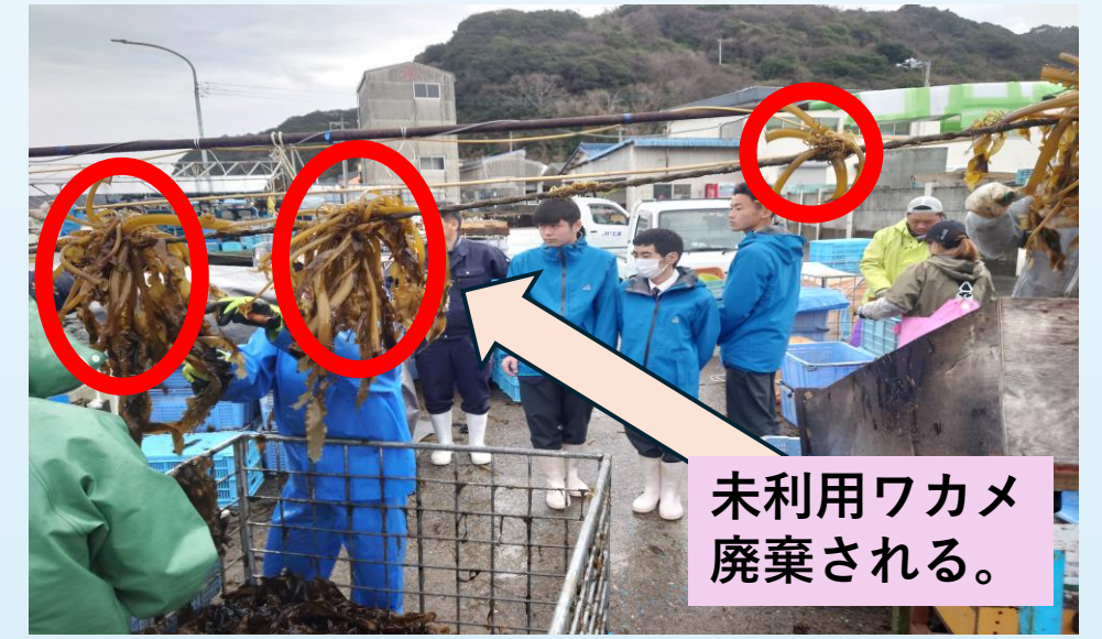
図1：ワカメ収穫現場見学

鳴門の渦潮が生み出す、潮流で大きく育った鳴門ワカメは、徳島県の特産品として知られているが、大きな課題がある。それは、ワカメ未利用部位の廃棄処分問題である。ワカメの根際は非可食部位として利用されることはなく、残念ながら市場には流通しない。そして、その多くが廃棄処分を余儀なくされている。ワカメを標準生ゴミとすると、焼却される際に年間157,927 tものCO 2 が排出されることになる。多くのワカメ生産者が廃棄処分について悩んでいることを知った私たちは、ワカメを活用した資材の研究・開発を行い、 生産される鳴門ワカメの廃棄ゼロを目指した新たな農業資材としての開発 に向けたプロジェクト学習に取り組んだ。