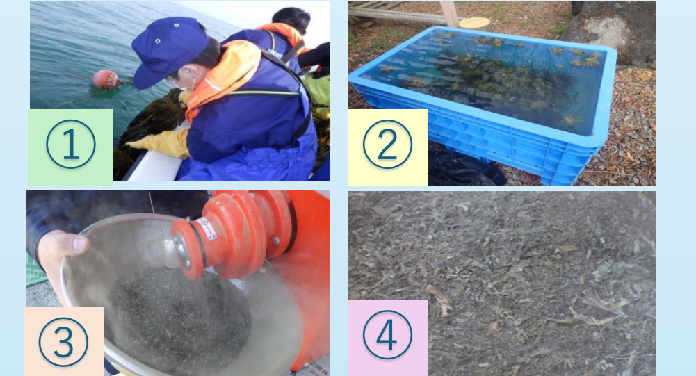
図2：ワカメ資材生産工程