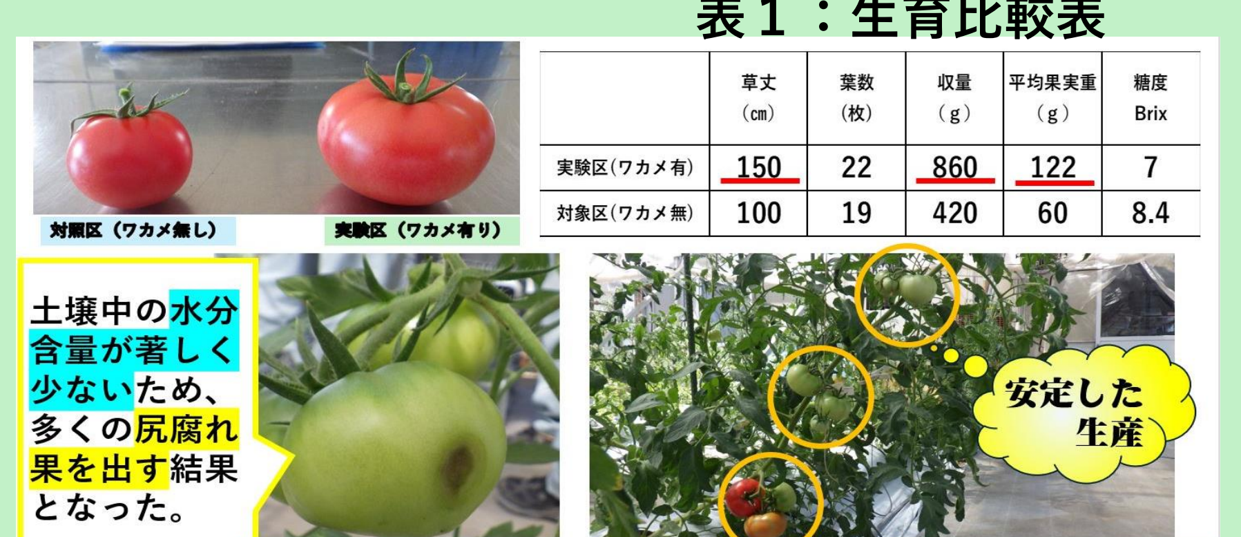
図8：果実の比較と生理障害発生の様子