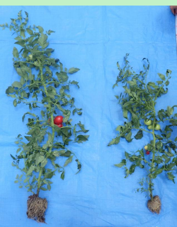
図6：成長比較 実験区（左）対照区（右）

ヤシガラ培土5 kgに対してワカメ資材を250 g加え、5%のワカメ資材を添加したベッドを作製した。対照区としてヤシガラ培土のみを入れたベッドを作成し、ワカメ資材の代わりとして緩効性肥料を各個体に5 gずつ施肥した。これにより、ワカメ肥料が緩効性肥料と同等かそれ以上の効果を発揮するかを検証した。結果は、実験区の草丈は平均で150cm、対象区の平均は100cm、葉数も実験区の方が多く、根域も大きく成長していた。収穫されたトマト1個あたりの平均果実重は、実験区は122 g、対象区は60 gで実験区の方が大きな果実をつけることができた。糖度は7から8度前後を推移しており、規格検査では、実験区の果実サイズはLもしくはM階級のA等級に該当する結果を残した。しかし、対象区では糖度は実験区よりも高かったものの、尻腐れ果の発生も多数確認され、全収穫量3分の1もの規格外トマトを出す結果となった。