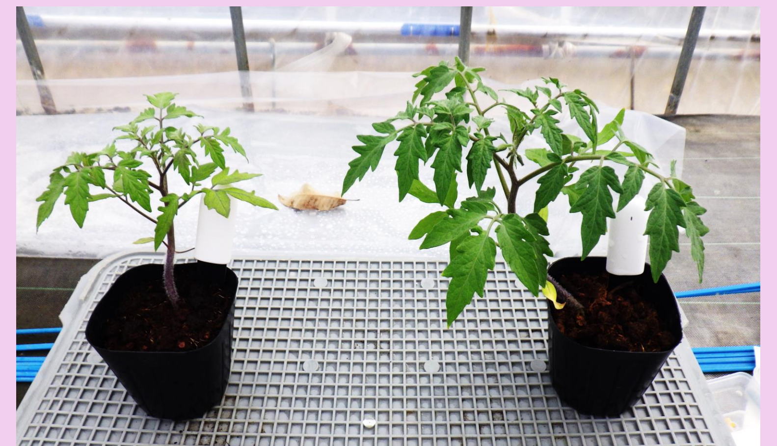
図5：対象区（左）と実験区（右）の比較